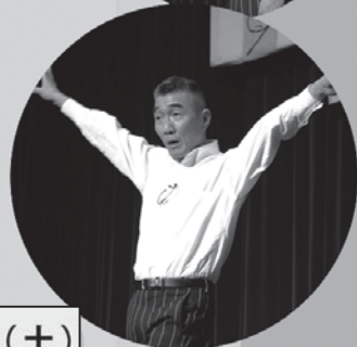
東久留米「九条の会」 8周年のつどい

東京芸術大学卒業。同大学音楽研究所講師。ソロ、室内楽、オーケストラ等で演奏活動している。